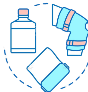
傷口照護及衛教服務